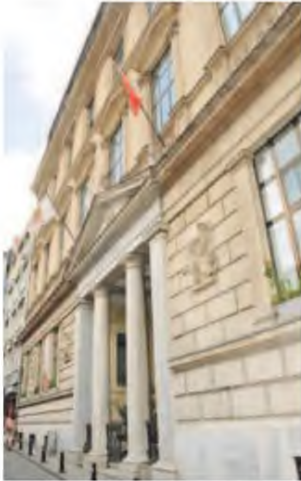
Ζωγράφειο Λύκειο Κωνσταντινούπολης

Η συνεργασία μας με τους Τούρκους είναι πολύ καλή και διέπεται από σεβασμό. Το γεγονός ότι αποκτάμε δικαιώματα που τα θεωρούσαμε χαμένα για χρόνια είναι ένα μεγάλο βήμα. Βέβαια, πρέπει να γίνουν ακόμη πολλά. Πρέπει να βλέπουμε με το βλέμμα του σήμερα και –γιατί όχι!– του αύριο ό,τι γίνεται και ό,τι δεν γίνεται και να μην