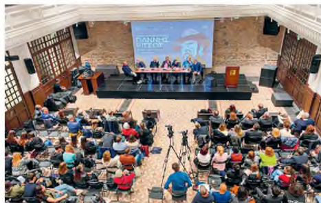
Μια συζήτηση για τον Γιάννη Ρίτσο στον χώρο της ανακαινισμένης Σχολής Γαλατά.

Τα παιδιά και οι καθηγητές τους συναντήθηκαν στο πλαίσιο του συνεδρίου με πενήντα επιστήμονες, λογοτέχνες, ηθοποιούς και δημοσιογράφους. Η ζωή και το έργο του Γιάννη Ρίτσου αναδείχθηκαν μέσα από τις πρωτότυπες ιδέες και δράσεις των μαθητών, τις εισηγήσεις των ειδικών και τις συζητήσεις που πραγματοποιήθηκαν. Η θεματολογία του συνεδρίου ήταν πολύπλευρη και άκρως ενδιαφέροντα. Οπότε οι μαθητές είχαν την ευκαιρία να γνωρίσουν εν τώ βάθει το έργο του μέσα από μια ολοκληρωμένη προσέγγιση. Απόλασαν λ.χ. την Ρένα Πιττακή στο θεατρικό αναλόγιο «Η Σονάτα του Σελινόφωτος», σε σκηνοθεσία Θεωδωρή