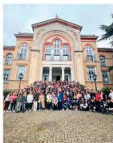
Αναμνηστική φωτογραφία από τη Θεολογική Σχολή Χάλκας.