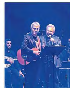
Ο Γιώργος Νταλάρας και ο Ζουζούφου Λιβανεζί στη σκηνή.