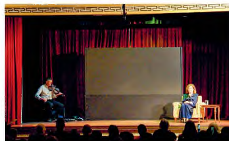
Η Ρένα Πιττακή αποθεώθηκε από τα παιδιά στο θεατρικό αναλόγιο «Η Σονάτα του Σελινόφωτος», σε σκηνοθεσία Θ. Γκόνη και μουσική Φ. Σιώτα.