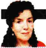
ΓΡΑΦΕΙ Η ΦΡΑΓΚΙΣΚΗ ΑΜΠΑΤΖΟΠΟΥΛΟΥ

Π οιος ήταν πραγματικά ο Βιζυηνός; Πόσα γνωρίζουμε για το εύρος του μεγάλου και πολύπλευρου έργου του, που δεν περιορίζεται στην ποίηση και την πεζογραφία αλλά περιλαμβάνει επιστημονικές μελέτες, δοκίμια για την αισθητική κι επίσης κριτικά κείμενα για τη ζωγραφική, τη γλυπτική, τους μεγάλους ποιητές της Ευρώπης, τους θεατρικούς συγγραφείς, ακόμη και μουσικούς όπως ο Μπετόβεν, ο Βάγκνερ και ο Βέρντι; Ποια ήταν η δαιδαλώδης και πολύπλοκη πορεία του, που τον έφερε από ένα χωριό της Ανατολικής Θράκης, ορφανό και πάμφτωχο, στα Πανεπιστήμια της Λειψίας, του Βερολίνου και της Γοττίνης κι από εκεί στα φιλολογικά σαλόνια των Παρισίων, του Λονδίνου και τέλος της επαρχιακής Αθήνας – μια περιπετειώδης διαδρομή που θα τελείωνε σε μια αίθουσα του Δρομοκαΐτειου; Πρόσωπο περιβλημένο από